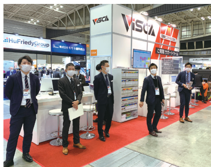
日本ビスカのブースの様子

3月開催の「日本デンタルショー2021」では、多くの先生方にビスカブースに足をお運びいただき、誠にありがとうございました。