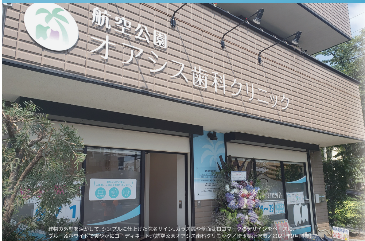
建物の外壁を活かして、シンプルに仕上げた院名サイン。ガラス扉や壁面はロゴマークのデザインをベースに、ブルー&ホワイトで爽やかにコーディネート。(航空公園オアシス歯科クリニック/埼玉県所沢市/2021年9月開業)