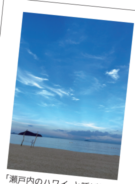
「瀬戸内のハワイ」と呼ばれる周防大島にて

山口県南東部の瀬戸内海に浮かぶ周防大島は、両親が住んでいて祖父母との思い出も多く、大好きな場所。行くと気分が晴れるので、夜出発して翌日に帰ってくる弾丸ツアーに家族をよくつきあわせています(笑)。